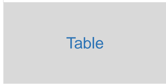
Table 1. Caption ----- [ Arial : 10pt ]